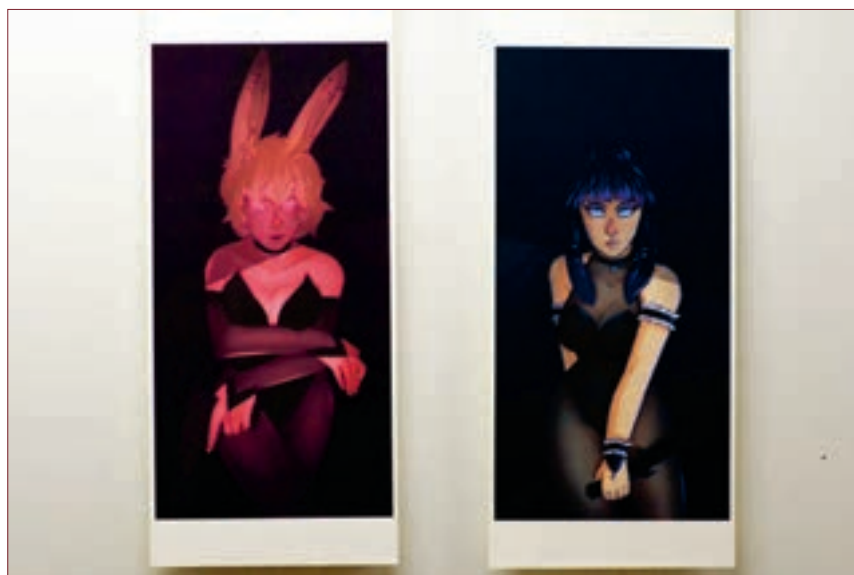
Œuvres de Caroline Rey.